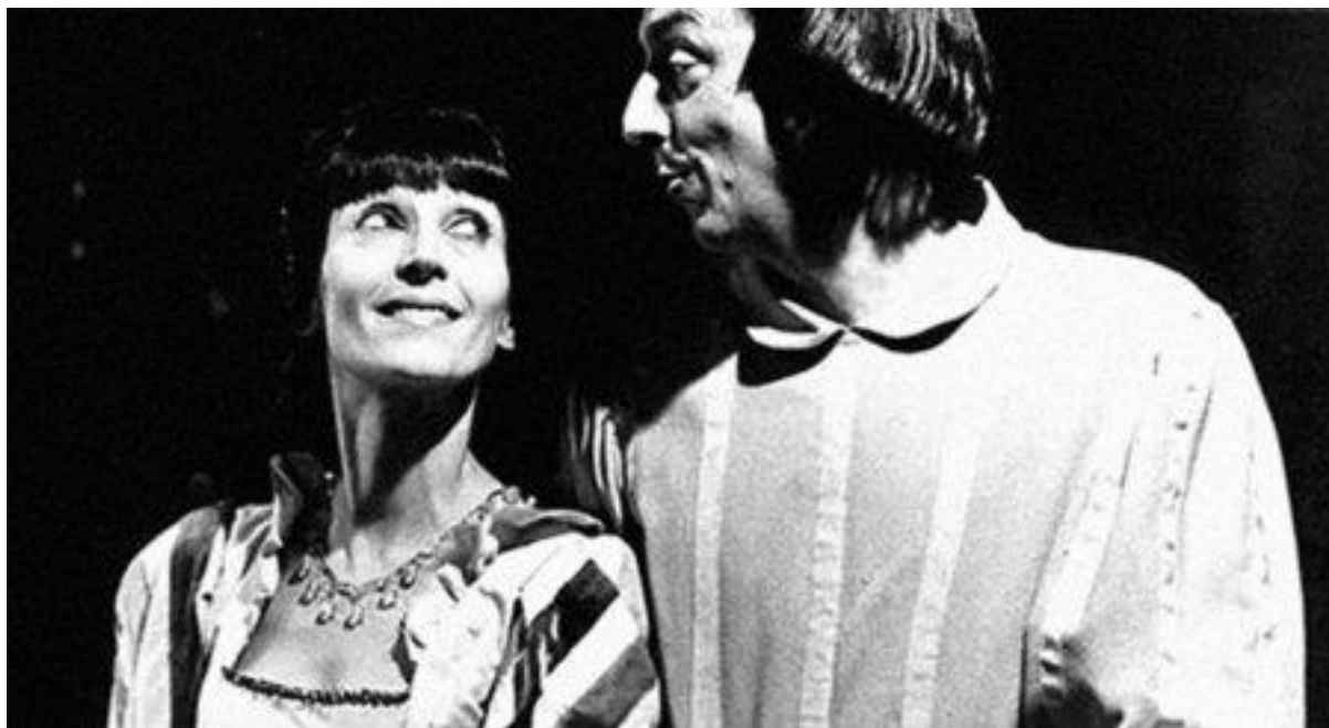
Giacomo Papi en 2018 à Turin.

Une biographie très complète retrace le formidable parcours d'une figure forte et rayonnante de la vie culturelle romande depuis les années 1950